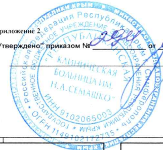
Схема подчиненности отделений ГБУЗ РК "РКБ им.Н.А.Семашко" 295017. г. Симферополь ул. Киевская 69. на 03.04.2023 г.